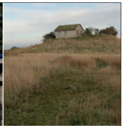
Inföhütte auf dem 'Richi-Hügel'