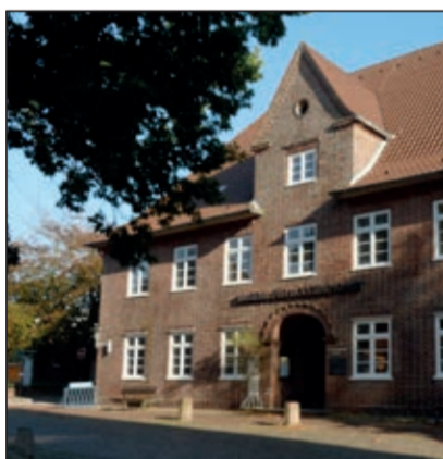
Richard-Haizmann-Museum in Niebüll