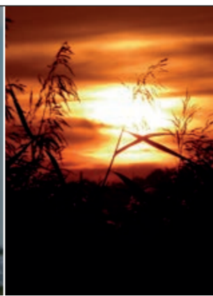
Reet im Gegenlicht