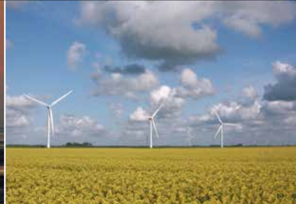
Rapsfeld im Sönke-Nissen-Koog