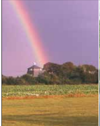
Petersburger Mühle in Drelsdorf